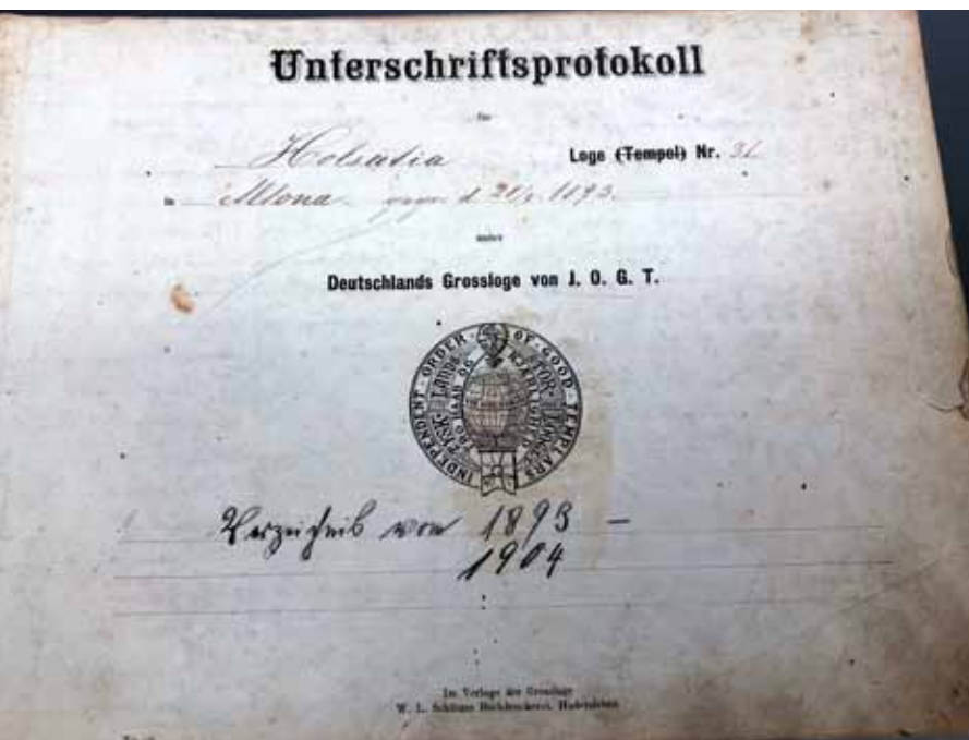
Ein Buch mit Unterschriftsprotokollen

Für den Landesverband Schleswig-Holstein hat diese einzigartige Einrichtung ebenfalls einen hohen Stellenwert. Eine Besonderheit, die bundesweit ihres Gleichen sucht, darf nicht unerwähnt bleiben: Im Guttempler-Museum treffen Traditionen sowie Erhalt und Pflege von Brauchtum auf die Moderne. Der Ausstellungsbereich wird aktuell auch für