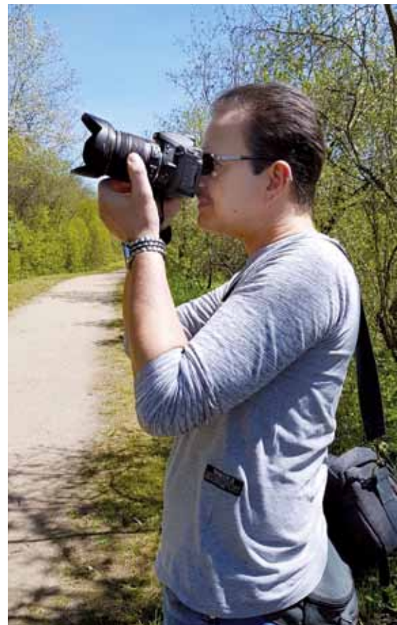
Mein neues Hobby ist die Fotografie

Die Arbeit in der Sucht-Selbsthilfe macht mir viel Freude und stärkt meine Überzeugung zur abstinenten Lebensweise.