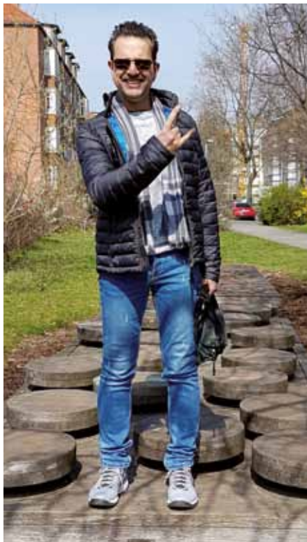
We will rock you ;-)

Die Guttempler kannte ich schon seit meiner Kindheit, durch meinen Vater, der selbst seit über 40 Jahren Guttempler ist. Also tat ich es ihm gleich und suchte eine Gemeinschaft in meiner Nähe auf: die Gemeinschaft „Lichtenrade.“ Dort wurde ich sehr herzlich aufgenommen und habe jede erdenkliche Hilfe bekommen. Durch die vielen Gespräche und die kompetente Beratung, ist mir nach und nach klargeworden, dass ich suchtkrank bin. Nach zwei professionellen Gesprächstherapien, der Ausbildung zum Suchthelfer und vielen Guttempler-Seminaren, bin ich nun schon seit Jahren der Ansicht, den richtigen Weg für mich gefunden zu haben. Mittlerweile bin ich Gruppenleiter unserer