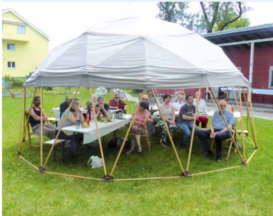
Treffen im Zelt