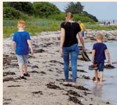
Wehmütiger Blick zurück auf die Sommerfreizeit in Dänemark 2020

Uns ist bewusst, dass gerade den Kindern durch Homeschooling und dem Hin und Her von Präsenz- und Onlineunterricht in den vergangenen Monaten viel zugemutet wurde. Und, dass gerade die, die oftmals schutzlos den Umständen zuhause ausgesetzt sind, dringend eine „Insel“ benötigen, die sich an ihren Bedürfnissen orientiert und die Zeit und Möglichkeit bietet, einfach